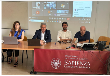
ATSC e Università La Sapienza

Roma – L'Associazione Agenti Teramo Senza Confini (ATSC) ha presentato a Roma i nuovi corsi di alta formazione in Soft skills & personal development nell'ambito dell'intermediazione e della finanza dedicati agli agenti di commercio e intermediari commerciali. La presentazione si è svolta lunedì 24 luglio, nel Dipartimento di Economia e Diritto dell'Università La Sapienza di Roma.